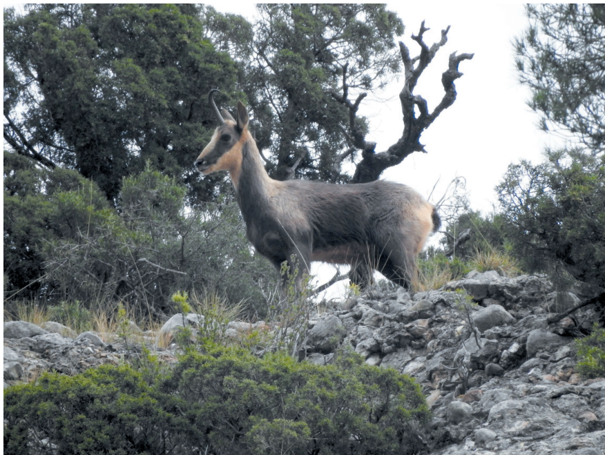
Figura 1. Ejemplar de sarrío macho al que le falta el cuerno derecho, fotografiado por Xavier Sampere en enero de 2019 en la Massana. En febrero de 2022 seguía estando presente en el interior de Montserrat.

No podemos afirmar que exista una población establecida en el macizo de Montserrat ya que la presencia de individuos es escasa y no se ha observado reproducción, aunque estos avistamientos espontáneos sugieren que el macizo actúa como un refugio de dispersión de ejemplares pirenaicos.